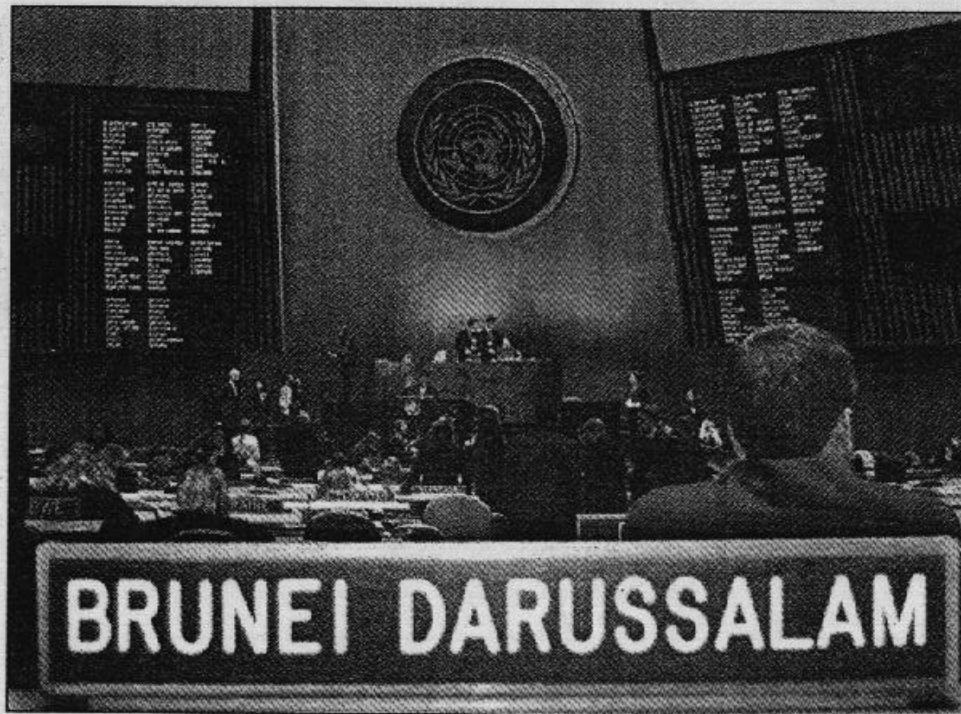
In der „heiligen Halle“ der Generalversammlung.

Ich war als Mitglied der Delegation der Universitäten Hohenheim und Stuttgart dabei. In verschiedenen Komitees haben wir versucht, die Außenpolitik des Sultanats Brunei und des Inselstaates Palau zu vertreten. Als „Botschafter“ von Brunei erörterte ich in der OIC (Organisation of Islamic Conferences) die islamische Sicht der Dinge. Ganz oben auf der Tagesordnung: der Israel-Palästina-Konflikt. Kein Wunder bei einer Vereinigung, die sich ursprünglich zum Schutz der Al-Aqsa-Moschee in Jerusalem zusammengetan hat. In formellen Reden und informellen Verhandlungen auf dem Gang wurden Resolutionen vorbereitet. Heiß diskutierte Themen waren der zukünftige Status von Ost-Jerusalem, die Flüchtlingsfrage und später auch die Wirtschaftsbeziehungen zwischen den islamischen Ländern. Von Brunei wurde erfolgreich eine Resolution zur Förderung des